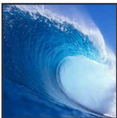
Energija morja (oceanov)